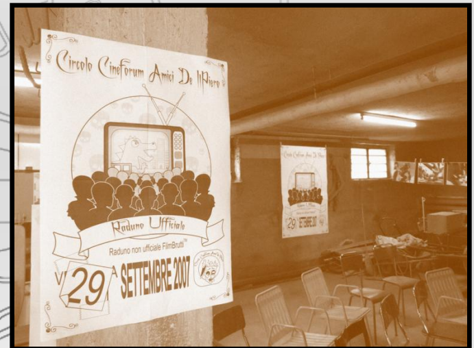
La sede estiva del circolo ritratta ai tempi del primo raduno ufficiale.