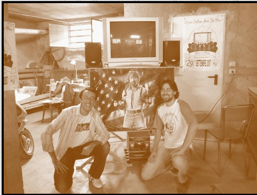
BT_Ettore posa nella foto di rito al fianco del Presidente di Filmbrutti.com

Il Circolo è inoltre oltraggiosamente orgoglioso di aver ospitato ai propri raduni lo staff di Filmbrutti.com.