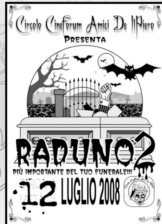
La locandina della seconda edizione della manifestazione.