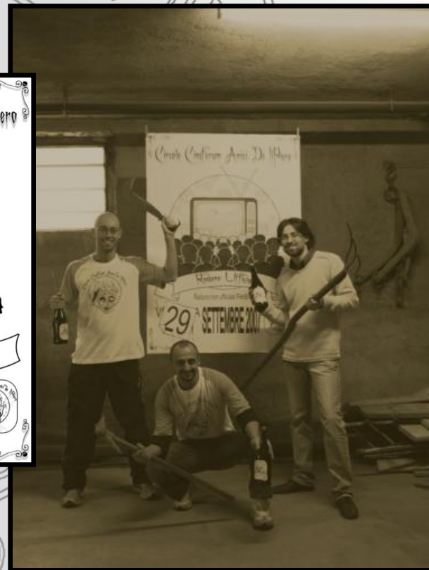
La locandina e la foto ufficiale di lancio del raduno 2007.